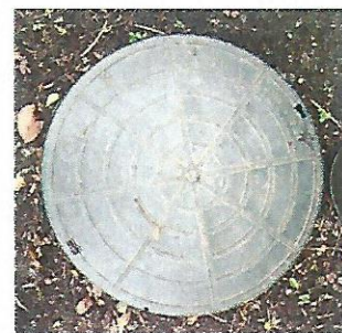
Dæksel til Vandmålebrønd

Dæksel til vandmålebrønd SKAL altid ligge på plads og må IKKE tildækkes af jord, bebyggelse eller terrasse.