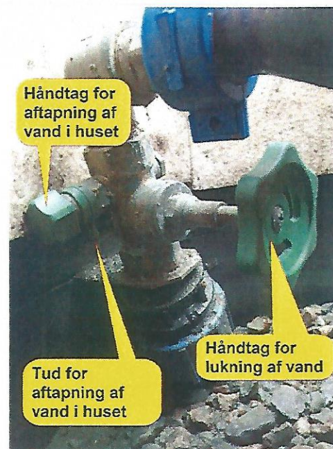
Spindelhane med aftapningshane

Det anbefales at afmontere blandingsbatterier i huset før vinteren, samt hælde auto-frostvæske i toilettets cisterne og kumme for at undgå frostsprængninger heri.